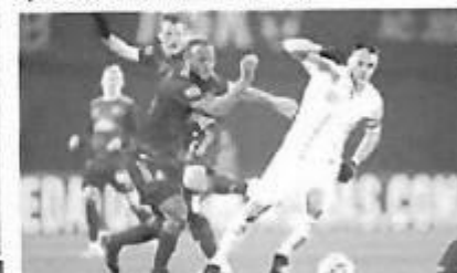
YEREMAJA I DUBIĆ u težkoj bitci uzorak kvalitete AHLINJEVIĆA koji je pogodica u 20. minuti i golov u Maksimiru

Njegova pobjeda postava se da... (u utakmici koja je kod 0:0 bez... ve nitro iz jedinstvenosti. Ali ni... a onda su i Opatovac i Antipašević dom...)