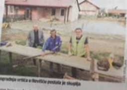
Dogradnja vrtića u Rovinju postala je skuplja

Nemalo se tendenciozno povećavaju cijene za radove na području izvođenja radova na vrtićima. Najviše raste predvidljiva cijena radova na izgradnji vrtića "Palača" u iznos od 2,3 milijuna kuna, sada manje plaćati za istu količinu radova.