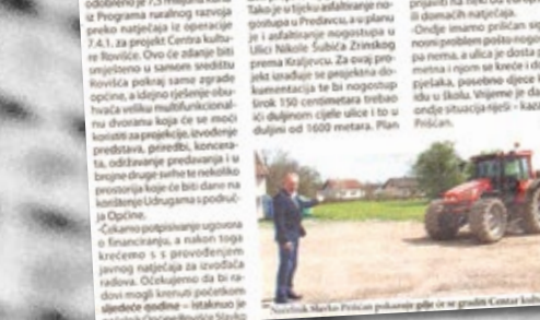
Radnici na radu u Rovinju

ROVINJSKI - Općina Rovinjska odobreno je 7,5 milijuna kuna iz Programa ruralnog razvoja preko narječja za izgradnju 7,5 t. za projekt Centra kulture u Rovinju. Ovo će stanje biti temeljeno u samom srednju Rovinjska pokraj same zgrade općine, a izdano izdano za izgradnju vrtića vrtića multifunkcionalna dvorana koja će se moći koristiti za projekcije, izvođenje predstava, primice, koncerta, održavanje predavanja i u druge druge svrhe te nekoliko perspektiva koje će biti dane na korištenje Ludugama u području Općine.