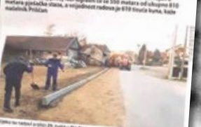
Radnici na radu u Rovinju

ROVINJSKI - Radnici na radu u Rovinju. Radnici na radu u Rovinju. Radnici na radu u Rovinju.