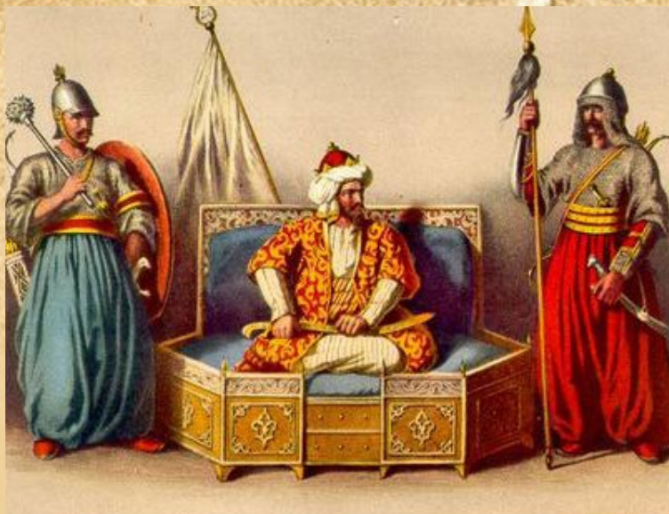
Prva turska provala u naše krajeve zabilježena je 1414. Tada je Rovišće i okolicu opljačkao Isak-beg

■ Krajem 16. stoljeća temeljito je obnovljena i pojačana rovišćanska tvrđa. U sredini se nalazila visoka zidana četverokutna zgrada, naokolo drveni plot, dosta visok. Iznutra je do polovice plota nabacana zemlja. U plotu su se nalazile 4 male bastije, a jedna kod ulaza. O