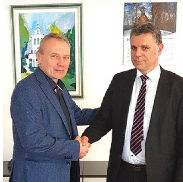
S potpisivanja ugovora u Ministarstvu za demografiju, obitelj, mlade i socijalnu politiku