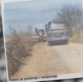
Putevi se proširuju i naspavaju

ROVINJCI - Poljoprivrednicima s rovinjskim područja sve je lakše dokazati do svojih njiva. Naime, Općina Rovinjska je prošle godine uložila preko milijun kuna kako bi uredila preko 30 kilometara poljskih puteva i putnih jaraka te makadamskih prometnica. Ove godine kreću se gotovo istim intenzitetom dalje. Najom je to ravnje uređeni putovi od Ulice Srebrnarske, Makom do Predavca u pravcu raskrižja cesta Predavac, Kraljevačka i Gorjane Rovinjske, na red su dolje i mnoge druge. Osim što je u pitanju lakša prevoznost, načelnik Slavko Prizmić ističe i sigurnost prometovanja.