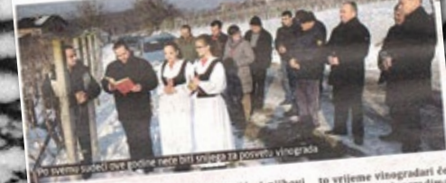
Uoči svemu sunđu, ove godine neće biti snijega za jesenski vinograd

ROVINJSKI - U subotu, 20. siječnja u Rovinju će se povodom Vinogradne održava već tradicionalna manifestacija - izložba vina Kraljevačka suza. Vinogradari i područja Rovinjska i njihovih prijatelji okupit će se u 10 sati kod će predati svezake svojih vina, a ono će se početi ocijenjivati u zgradi Općine Rovinjske. Za vrijeme vinogradari će se okupiti u vinogradima u Kraljevici te će obilježiti početak vinogradarskih radova, a svećenik će posvetiti vinograd. [sg]