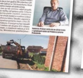
Radnici na radu u Rovinju

ROVINJSKI - Radnici na radu u Rovinju. Radnici na radu u Rovinju. Radnici na radu u Rovinju.