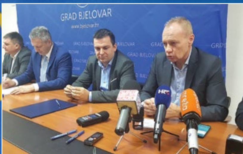
Potpisivanje je ugovora za sufinanciranje Kulturnog centra Rovišće