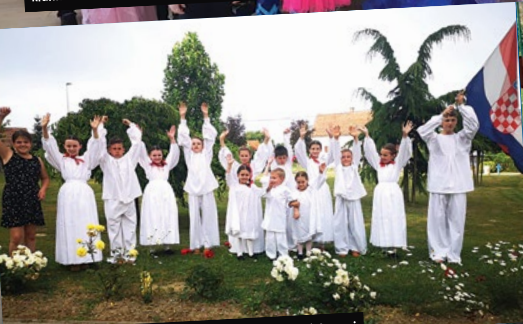
Susreti folkloru osdržani su u Školsko – sportskoj dvorani Osnovne škole Rovišće u subotu 15. lipnja 2019.