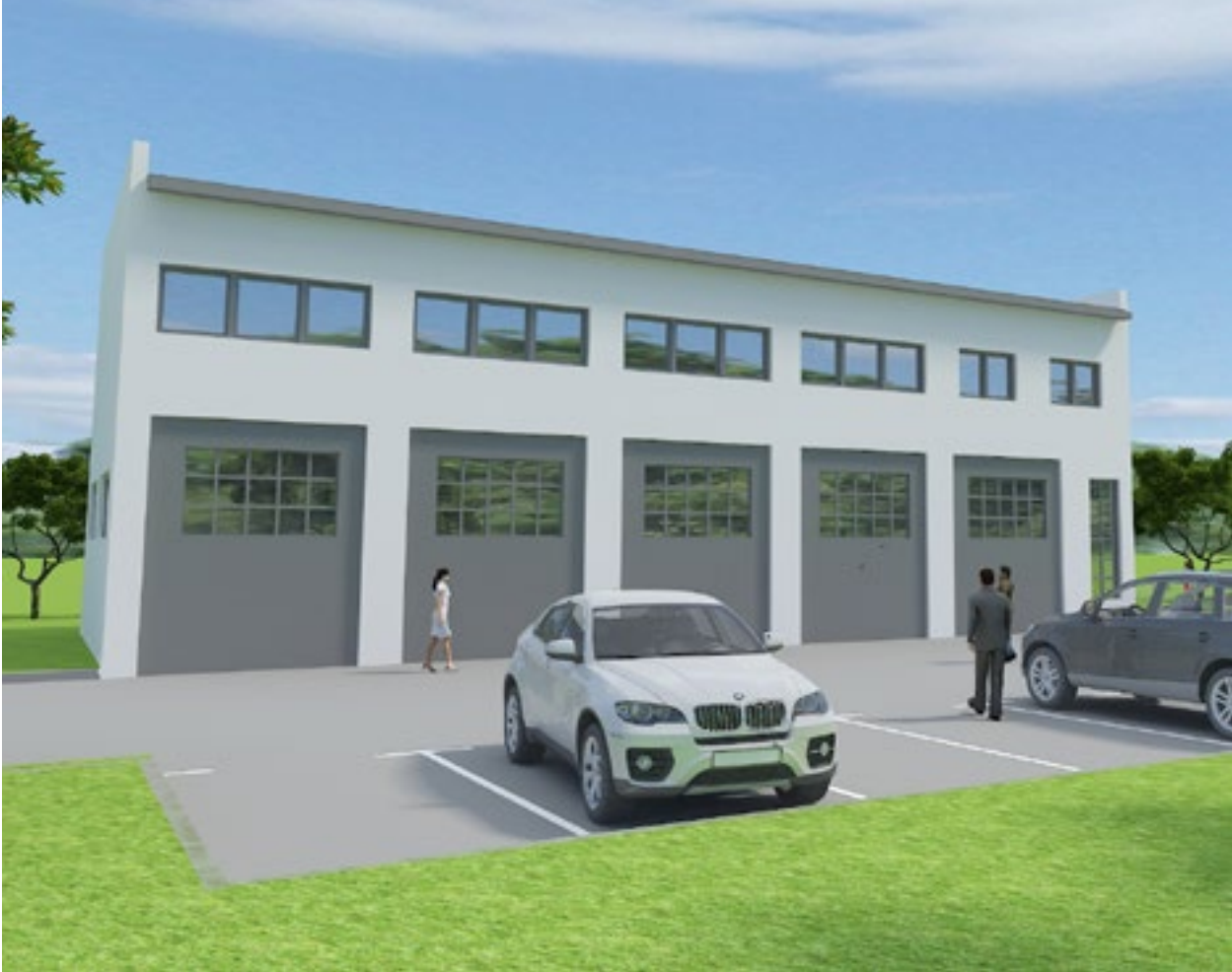
Dom će se nalaziti u samom središtu Rovišća, na Laništu