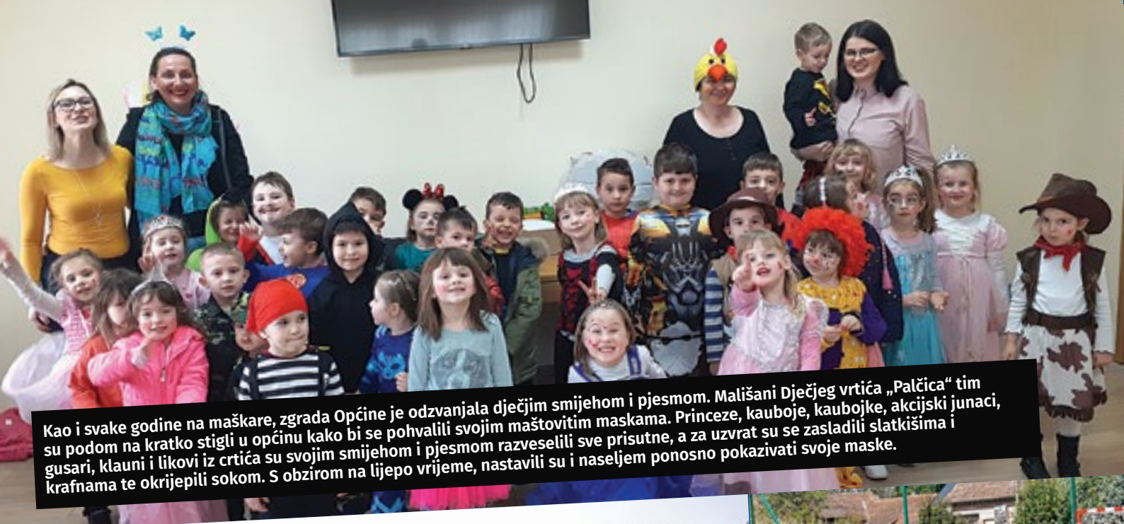
Kao i svake godine na maškare, zgrada Općine je odzvanjala dječjim smijehom i pjesmom. Mališani Dječjeg vrtića „Palčica“ tim su podom na kratko stigli u općinu kako bi se pohvalili svojim maštovitim maskama. Princeze, kauboje, kaubojke, akcijski junaci, gusari, klauni i likovi iz crtića su svojim smijehom i pjesmom razveselili sve prisutne, a za uzvrat su se zasludili slatkišima i krafnama te okrijepili sokom. S obzirom na lijepo vrijeme, nastavili su i naseljem ponosno pokazivati svoje maske.