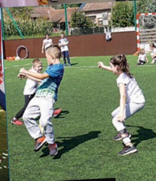
Olimpijski dan u Predavcu