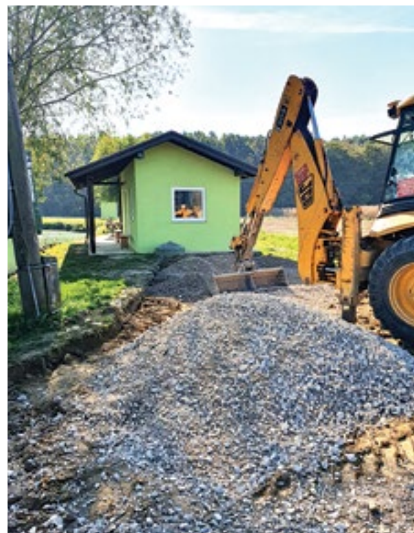
ŠRD „Grabik“ iz Predavca je radio na uređenju okoliša oko svog ribnjaka.