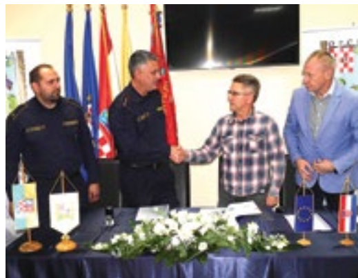
Ugovor o izgradnji potpisan je s tvrtkom "Novi stan" iz Kapelice kraj Garešnice

Dom će se nalaziti u samom središtu Rovišća, na Laništu i to na zemljištu koje je u vlasništvu općine i koje je dano na korištenje vatrogascima. Rok za izgradnju doma je godina dana od uvođenja u posao, a dom će osim vatrogasaca, koristiti i ostali mještani, prvenstveno članovi udruga građana. U planu je i izgradnja prostorijske koju će koristiti mještani, a važno je naglasiti da se cjelokupni projekt financira sredstvima Europske unije, odnosno ministarstva. Trošak općine i DVD-a bio je maksimalno 200 tisuća kuna, što je podrazumijevalo izradu dokumentacije, doprinose, dozvole i sve ostalo što je potrebno.