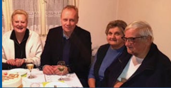
Bračni par Kozlik

DA-želim posao! Projekt financiran iz Javne Agencije za suradnju i razvoj