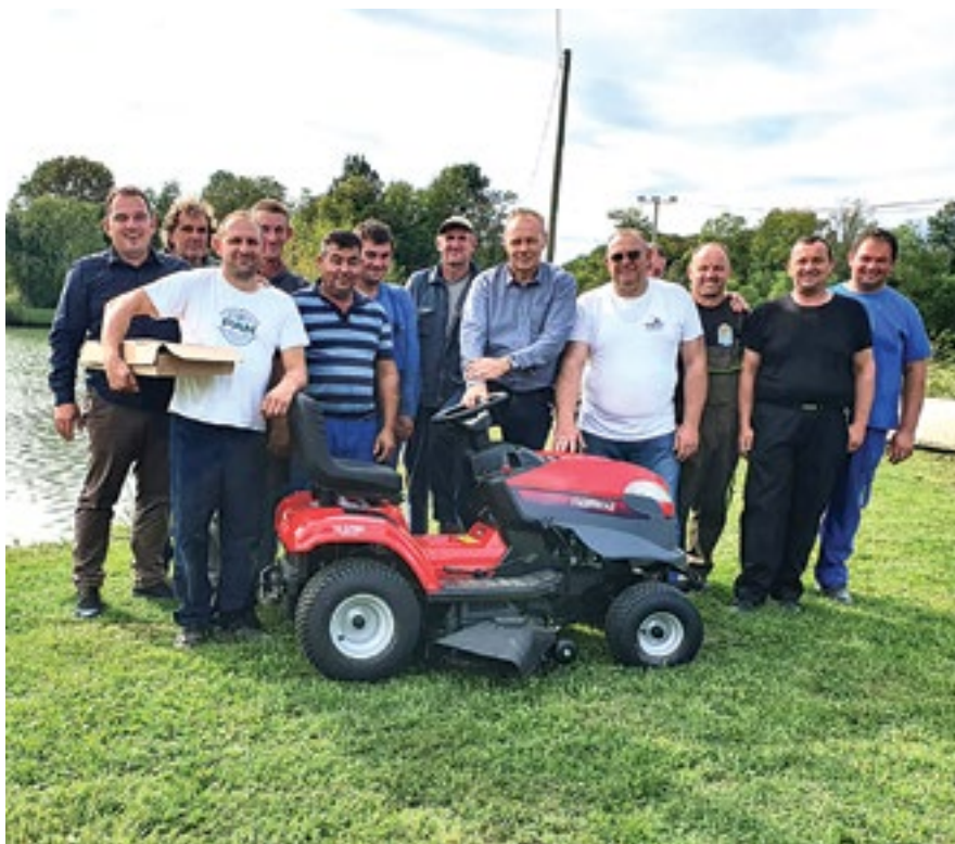
Uz pomoć Općine Rovišće, SRD „Ribič“ Rovišće je nabavilo traktor kosilicu kojom će lakše održavati prostor oko ribnjaka.