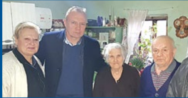
Bračni par Krsnik