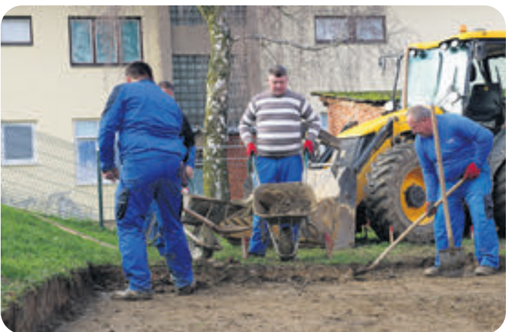
Radovi na Dječjem vrtiću Palčica