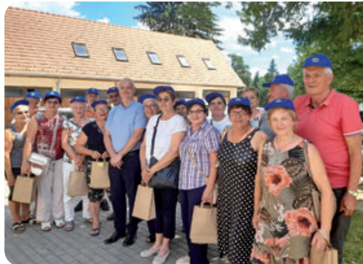
Udruge umirovljenika Predavac i Rovišće u posjeti prijateljskoj Općini Somogyvár