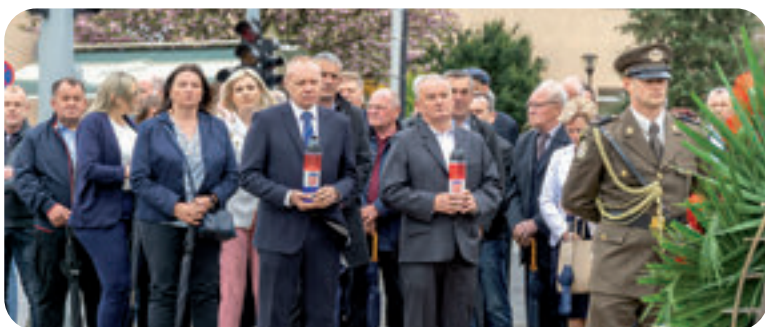
Polaganjem vijenaca odana je počast poginulim braniteljima