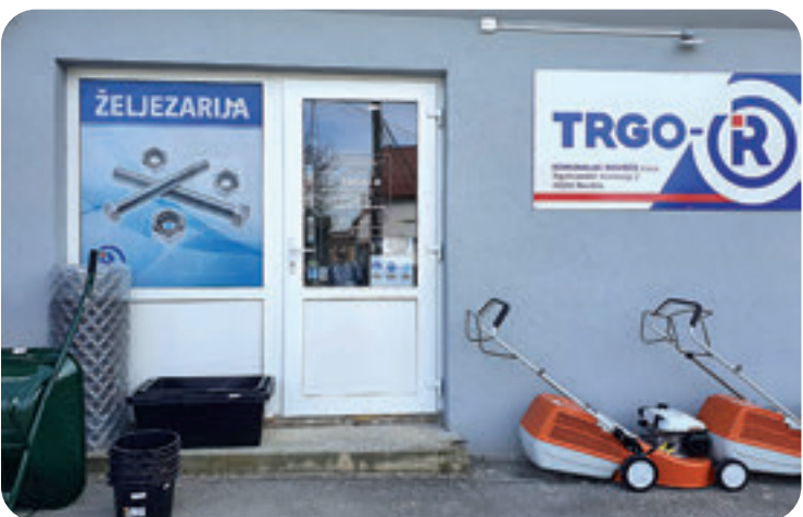
Željeznarija rovišćanskog komunalca odlično je prihvaćena kod mještana