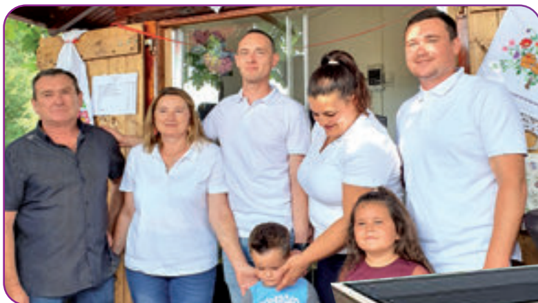
U središtu Rovišća otvorena trgovina s proizvodima mini sirane OPG Maciček. S radošću očekuju novu tržnicu!

Tržnica će nama kao proizvođačima donijeti gdje ćemo plasirati svoje proizvode i kako bi se naš dugogodišnji trud i rad isplatio. Za sada prodajemo uz prometnicu gdje je gust promet, u centru Rovišća gdje zarađujemo najviše od prolaznika i mještana općine Rovišće. Vjerujem da će novoizgrađena tržnica imati dobar prilaz uz prometnicu i parkiralište koje je predviđeno kako bi bilo što dostupnije za prolaznike.