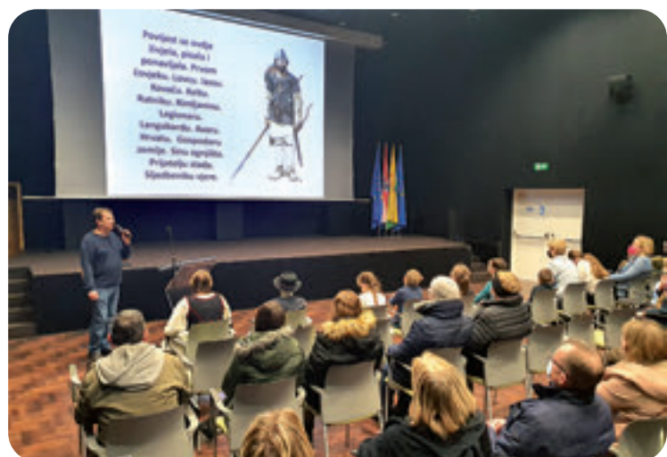
Prozor u prošlost Rovišća - Noć muzeja 2022.