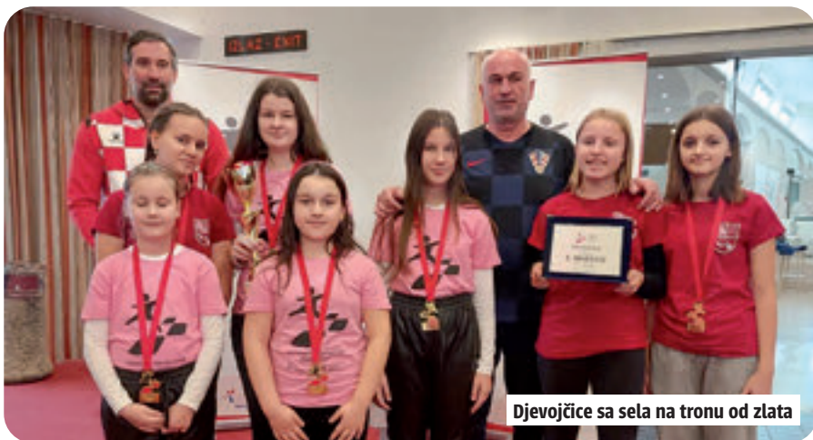
Djevojčice sa sela na tronu od zlata