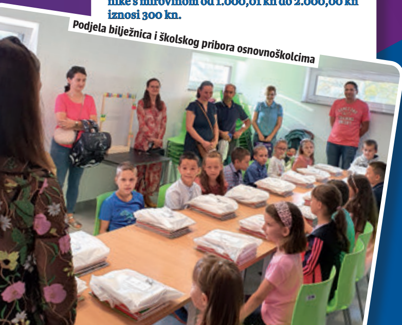
Podjela bilježnica i školskog pribora osnovnoškolcima

Općina Rovišće sa Ministarstvom pravosuđa i uprave potpisala je Sporazum kojim se uključila u sustav e-Novorođenče – uslugu koja između ostalog, omogućuje online podnošenje zahtjeva Općini Rovišće radi ostvarenja prava na novčanu pomoć po rođenju djeteta. Prednost podnošenja zahtjeva za ostvarenjem prava na novčanu pomoć po rođenju djeteta putem usluge e-Novorođenče je što roditelji (više) ne moraju dolaziti osobno ili poštom dostavljati zahtjev i svu potrebnu dokumentaciju, već će sve to moći učiniti na jednom mjestu prilikom same prijave djeteta u matičnom uredu ili putem sustava e-Građani kroz usluge e-Novorođenče. Uvjeti Općine Rovišće odnosno iznosi potpore za novorođenčad ostaju nepromijenjeni.