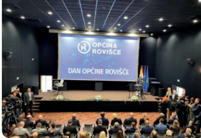
Svečana sjednica povodom Dana Općine Rovišće