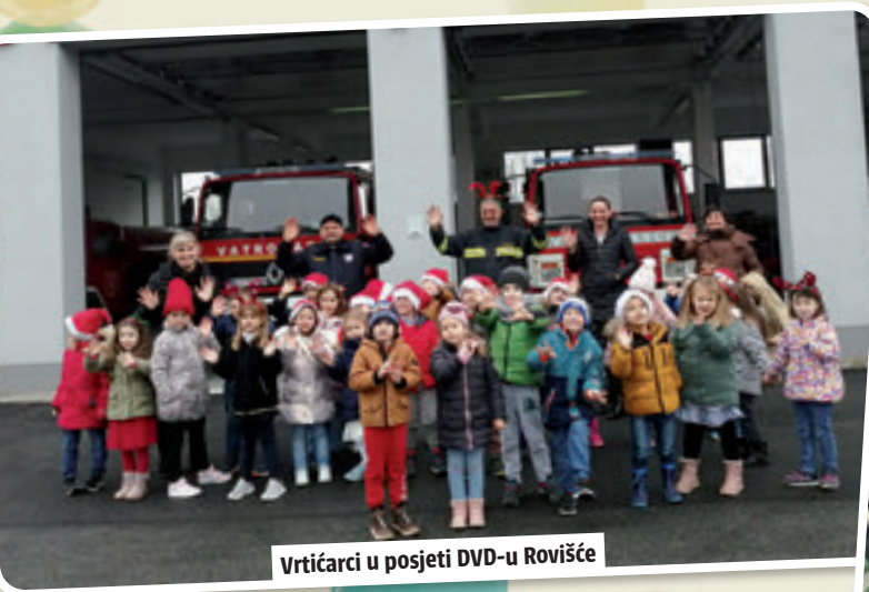
Vrtačarci u posjeti DVD-u Rovišće