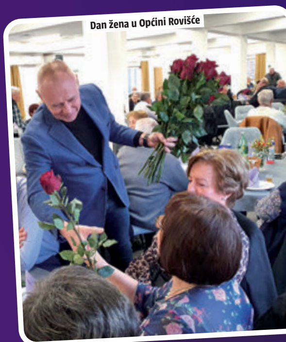
Dan žena u Općini Rovišće

Općina Rovišće uz Projekte Zaželi koji obuhvaćaju stare i nemoćne pomaže udrugama umirovljenika Rovišće i Predavac na koje smo osobito ponosni