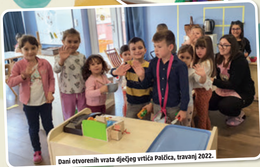
Dani otvorenih vrata dječjeg vrtića Palčica, travanj 2022.