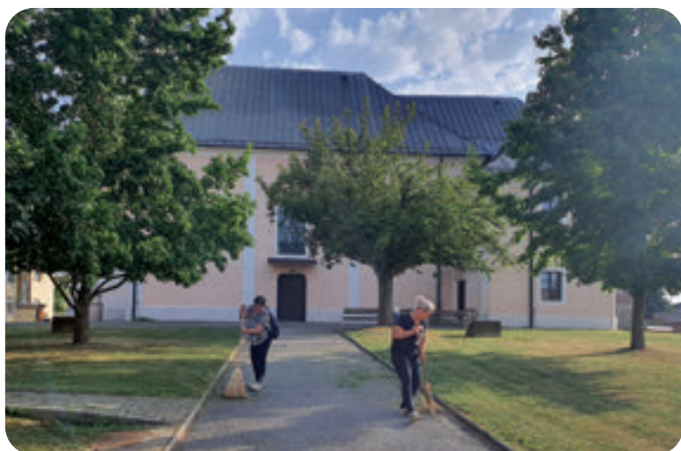
Općina Rovišće provodi svake godine zapošljavanje unutar Programa javnih radova