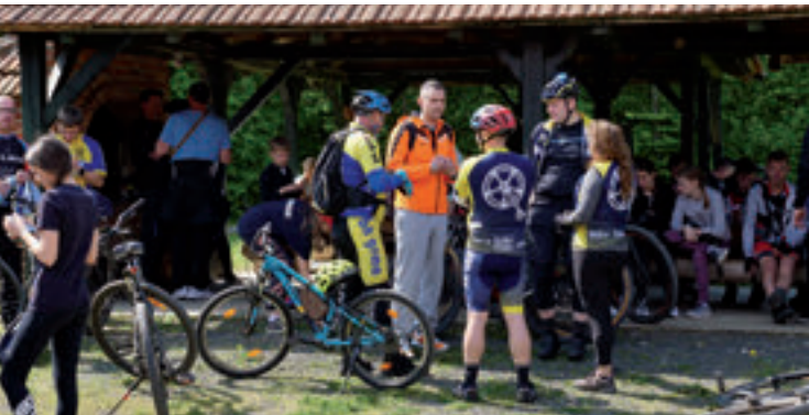
Prvomajska bicikljada u organizaciji Općine Rovišće, TKW Fox i bjelovarskih biciklista