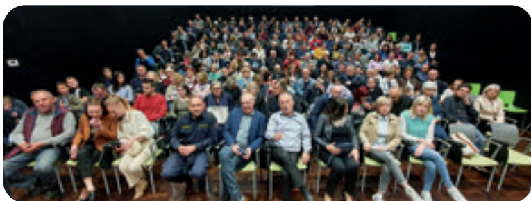
Kazališne predstave su privukle brojnu publiku