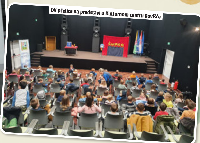
DV pčelica na predstavi u Kulturnom centru Rovišće