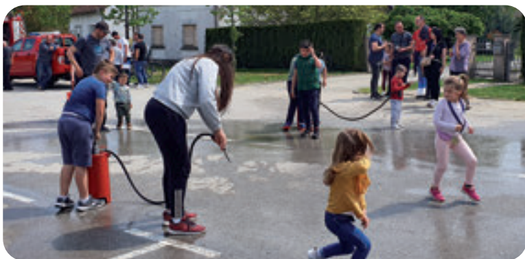
Pokazne vježbe za djecu Vatrogasne zajednice Općine Rovišće