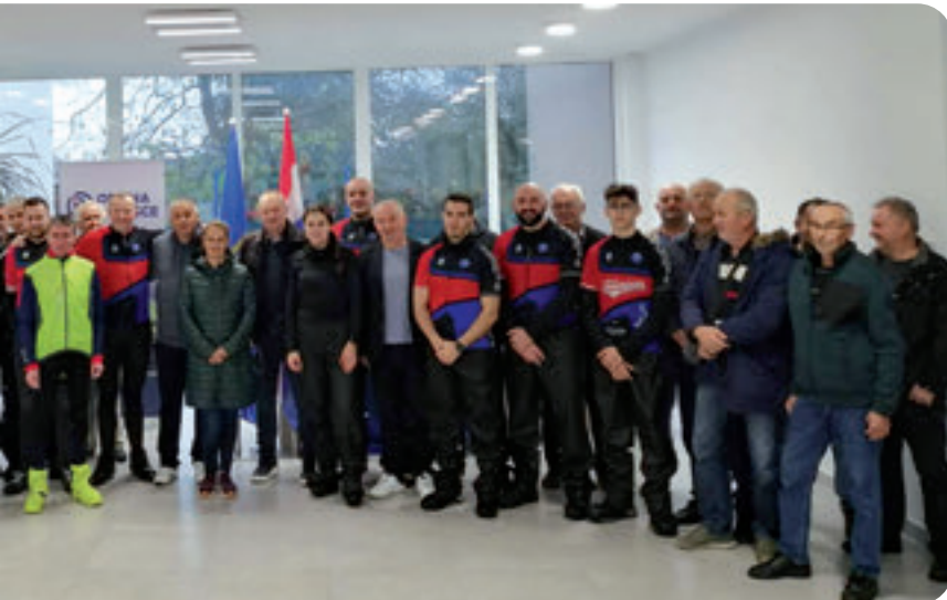
Posjet Biciklističkog kluba "Rama" Općini Rovišće - 18. studenoga 2022.; Ramska zajednica Bjelovar i Općina Rovišće