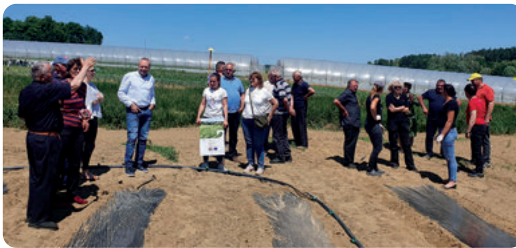
Udruga voćara i vinogradara Rovišće u posjeti OPG-u Džolan