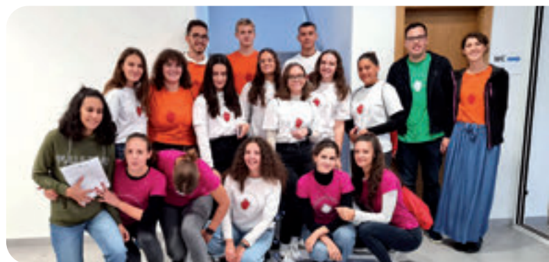
Susret Hrvatske katoličke mladeži - posjet Općini Rovišće