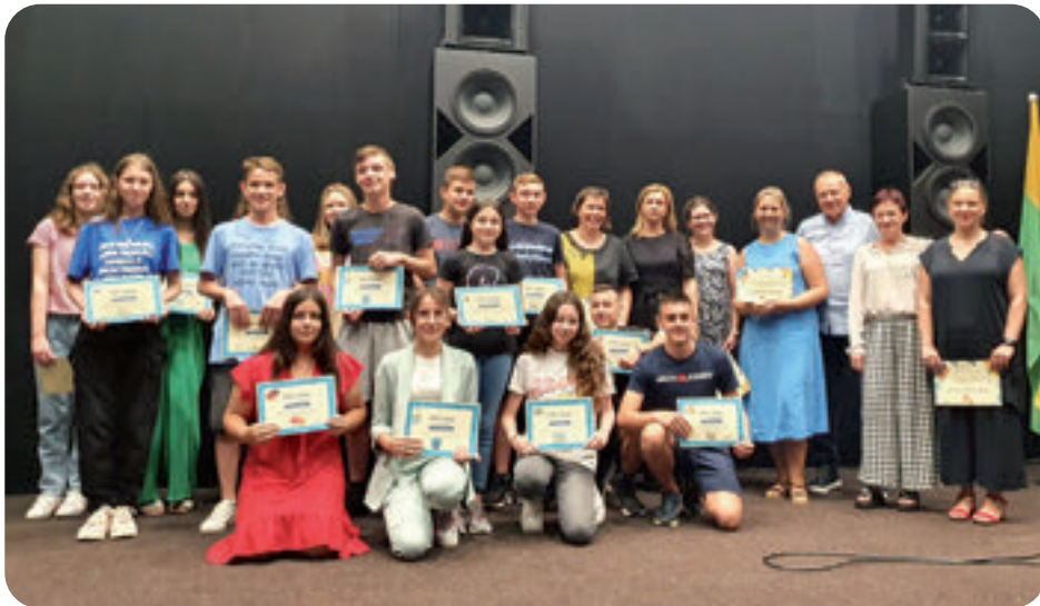
Svečana dodjela svjedodžbi i nagrada najboljim učenicima i djelatnicima OŠ Rovišće