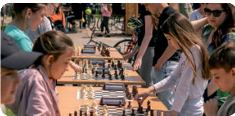
Mali čuvari rovišćanske šahovske tvrđave