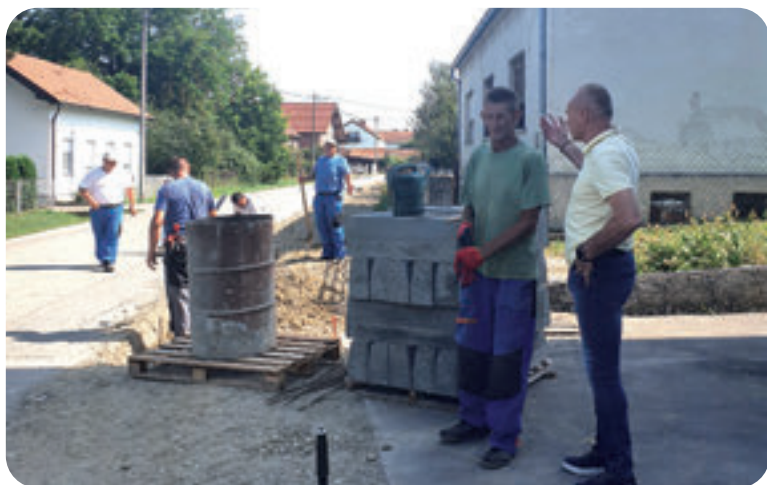
Uređenje infrastrukture u općinskim naseljima