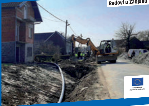
Radovi u Žabjaku

ZAVRŠETKOM PROJEKTA "POBOLJŠANJE VODO-KOMUNALNE INFRASTRUKTURE AGLOMERACIJE BJELOVAR" (Bjelovar- Gudovac-Rovišće) SADA SVA NASELJA U OPĆINI ROVIŠĆE IMAJU PRIKLJUČKE ZA VODOVOD