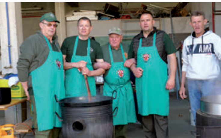
Lovačka udruga "Srndać" Rovišće u pripremi prvomajskog graha za mještane