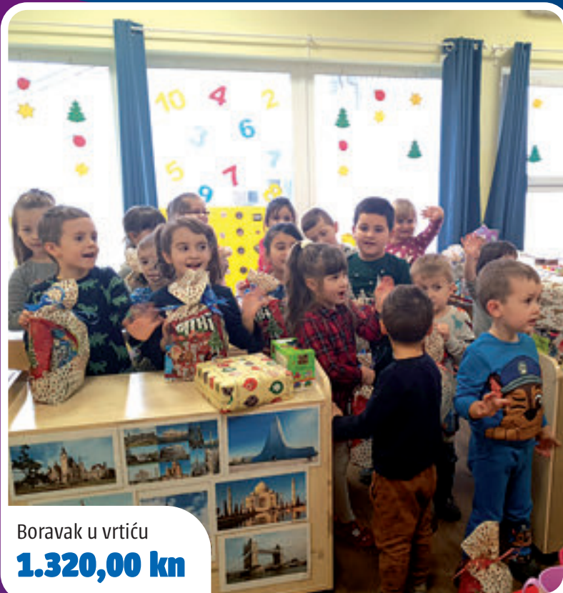
Boravak u vrtiću 1.320,00 kn

Općina Rovišće nastavlja brigu o svim dobnim skupinama, dodjeljuje jednokratne potpore za novorođenčad u iznosu od 1.500,00 kn po djetetu, sufinancira boravak u dječjem vrtiću u iznosu od 1.320,00 kn, financira program male škole, osigurava osnovnoškolcima bilježnice i školski pribor i školski pribor, srednjoškolcima sufinancira školski prijevoz, a studentima dodjeljuje jednokratne financijske potpore koje su povećane na 2.500,00 kn po studentu. Pažnja je posvećena i starijoj dobnjoj skupini pa tako uz poticaj rada udruga umirovljenika koje su vrlo aktivne na našem području, na radost svih počinje provedba projekta Zaželi gdje je zaposleno 15 žena koje obilaze 90 krajnjih korisnika, starijih i nemoćnih kojih itekako ima u ruralnim sredinama. Općina pomaže i podupire udruge umirovljenika koje su jedne od najaktivnijih udruga na području Bjelovarsko-bilogorske županije na što smo iznimno ponosni. Ono što će razveseliti naše najstarije u blagdanskom periodu jesu božićnice čiji su iznosi ove godine povećani i dolaze im poštom na adresu stanovanja. Za umirovljenike s mirovinom do 1.000,00 kn visina božićnice iznosi 350,00 kn, dok za umirovljenike s mirovinom od 1.000,01 kn do 2.000,00 kn iznosi 300 kn.