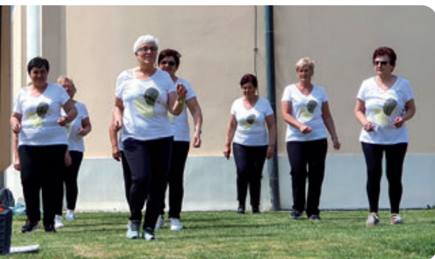
Plesna skupina "Zlatni koraci" Udruge umirovljenika Predavac