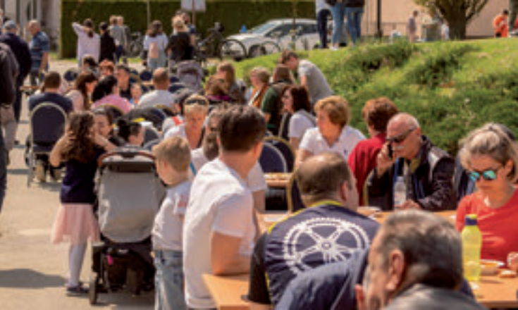
Podjela prvomajskog graha