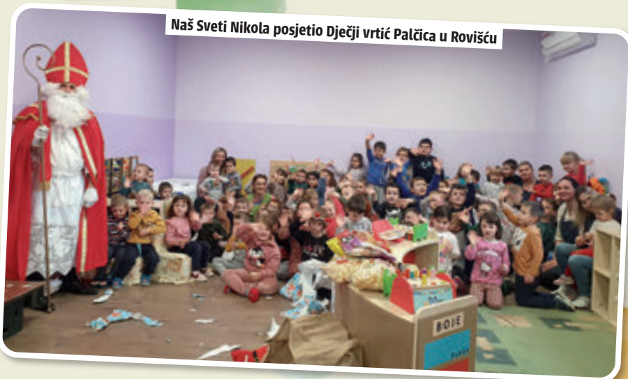
Naš Sveti Nikola posjetio Dječji vrtić Palčica u Rovišću