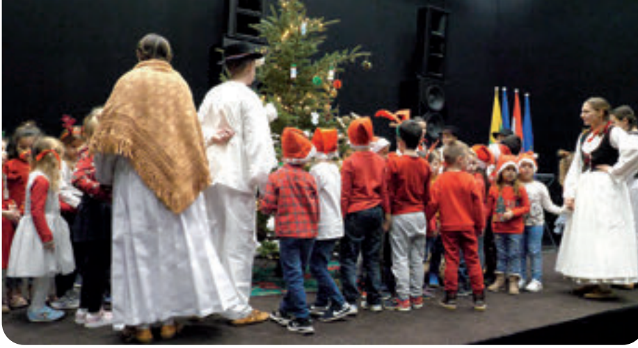
Kulturno umjetničko društvo s dječjim vrtićem