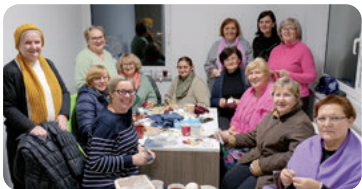
Udruga žena Rovišće u izradi božićnih ukrasa