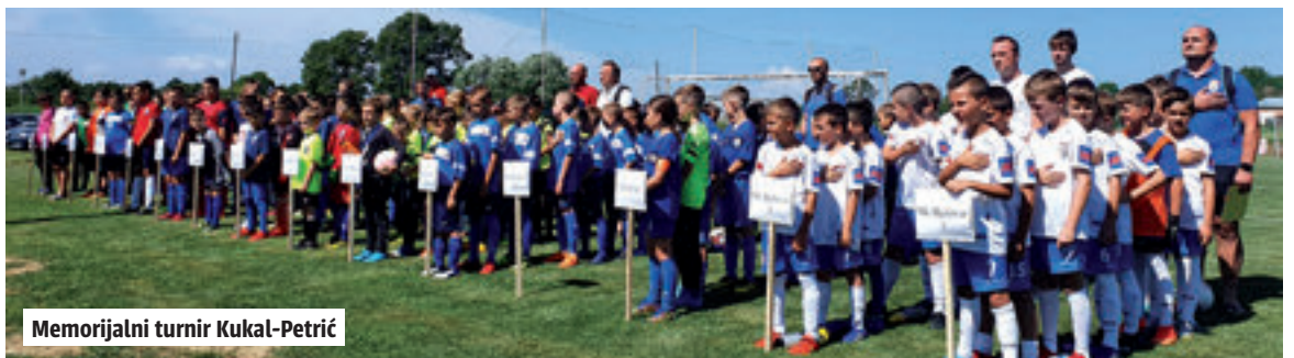
Memorijalni turnir Kukul-Petrić

Pored šahovskog zlata iz Poreča osnovna škola Rovišće provodi i tri projekta. Za učenike od prvog do četvrtog razreda provodi se projekti 'Univerzalna škola', učenici od petog do osmog razreda uključeni su u projekt 'Vježbaonica', dok se uspješno provodi i projekt 'Školski praznici' za sve učenike poslije nastavne godine kojeg je ovog ljeta pohađalo više od 70 djece. (daž)