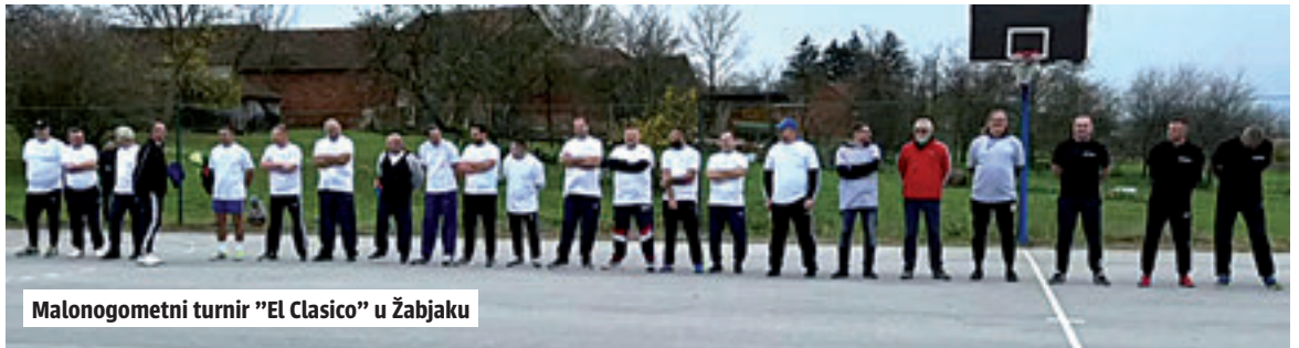
Malonogometni turnir "El Clasico" u Žabjaku

Jedan od razloga velike povezanosti stanovnika općine Rovišće krije se u sportu s kojim su doslovno pupčano vezani. Imajući u vidu tu simbiozu nije ni čudo što se taj povezanost u Rovišću daje velika pozornost i što je sport način života, ali i tradicija od koje se neodustaje.