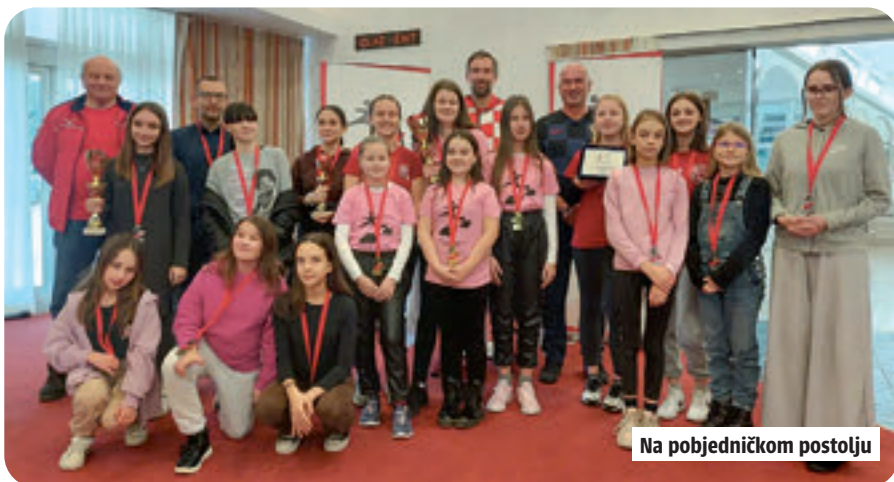
Na pobjedničkom postolju