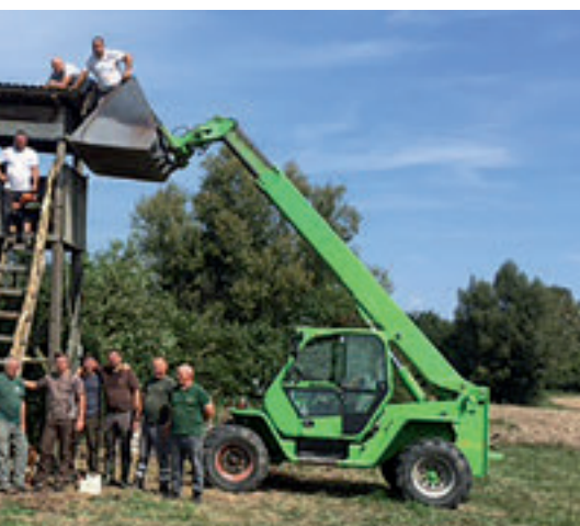
Izrada čeke, Lovačka udruga "Kuna" Kraljevac