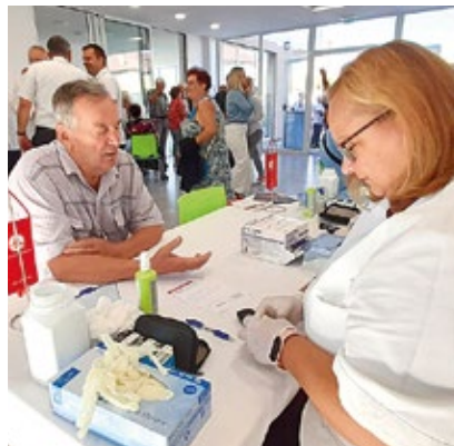
Rovišće organiziralo javnozdravstvenu akciju mjerenja šećera u krvi i krvnog tlaka s ciljem ranog otkrivanja i prevencije bolesti.

Održanja je hvale vrijedna javnozdravstvena akcija posvećena prevenciji i ra-