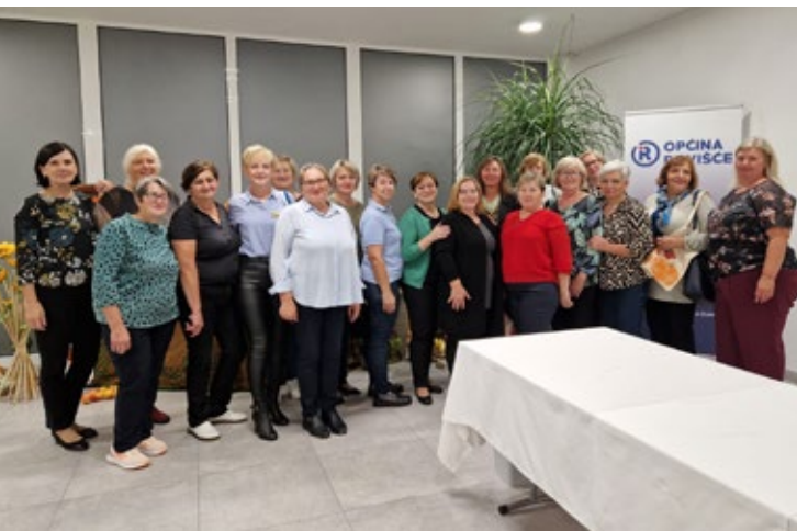
Udruge žena Rovišće - Prva mala bučijada