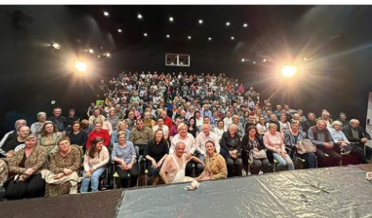
Predstava Beba- Kerekesh Teatar