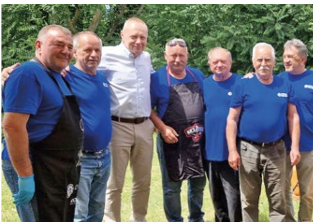
Sudjelovanje udruga na natjecanju u kuhanju u mađarskoj Općini Somogyvar