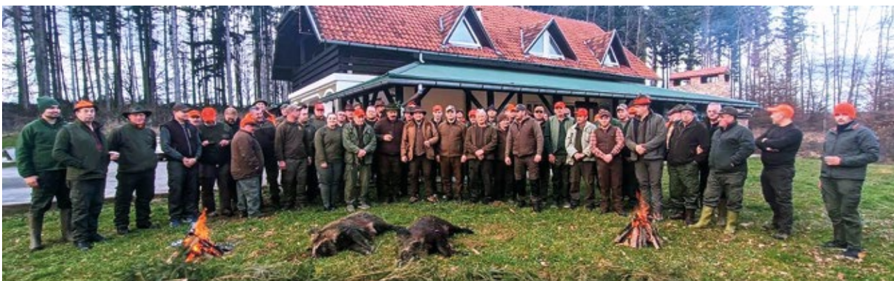
Lovačka udruga "Srndać" Rovišće s gostima - organiziran skupni lov na divlje svinje