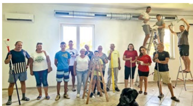
Radna akcija u Društvenom domu Prekobrdjo

Naš mjesni dom centar je svih događanja, pa smo ga uredili sa srcem i uživamo u njemu.