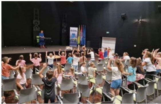
Glazbena igraonica i radionica Općine Rovišće u suradnji s Glazbenom školom Vatroslav Lisinski Bjelovar uspješno funkcionira od rujna 2023.