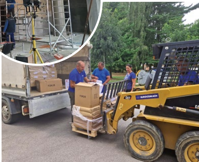
Podjela bilježnica i školskog pribora OŠ Rovišće