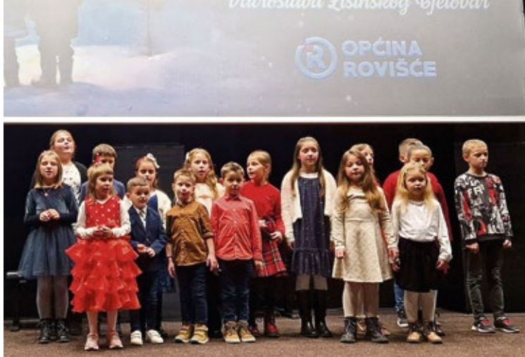
Božićni koncert Ususret Božiću prvi koncert Glazbene igraonice Općine Rovišće u suradnji s Glazbenom školom Vatroslav Lisinski Bjelovar