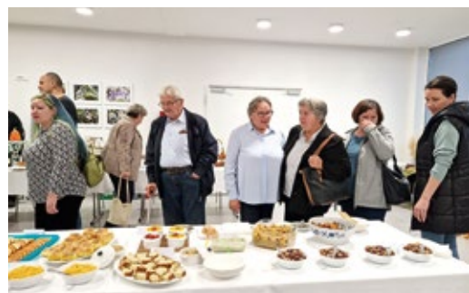
Prva mala bučijada Općine Rovišće