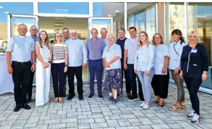
Radionica u organizaciji Hrvatskog fotosaveza

Ove aktivnosti označavaju našu posvećenost obrazovanju, kulturi i zajednici. Zahvaljujemo svima koji su podržali naše događaje i nadamo se još većem broju uspješnih aktivnosti u narednom razdoblju.