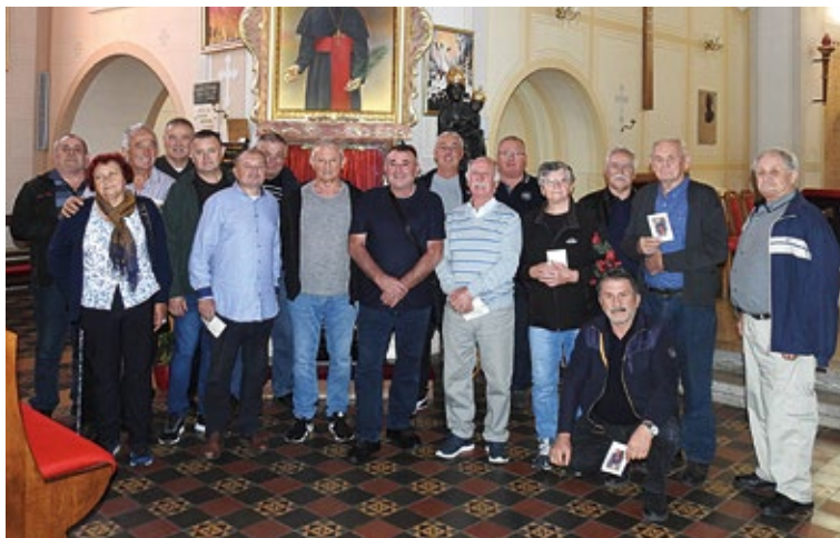
Udruge voćara i vinogradara na izletu