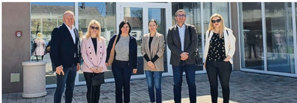
Predstavljanje strategije razvoja turizma za područje Bilogora- Bjelovar - Institut za turizam

ODRŽAVANJE POZITIVNOG I KONSTRUKTIVNOG ODNOSA S INSTITUCIJAMA I ORGANIZACIJAMA NA LOKALNOJ I NACIONALNOJ RAZINI KLJUČNO JE ZA RAZVOJ I NAPREDAK NAŠE ZAJEDNICE.