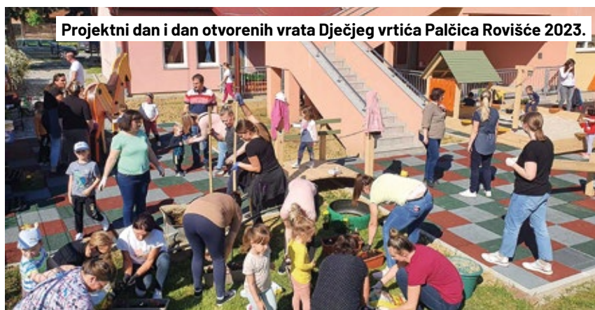
Projektan dan i dan otvorenih vrata Dječjeg vrtića Palčica Rovišće 2023.

Ovime smo tek malo zavirili u proteklu godinu u vrtiću. Ukratko, bilo nam je zabavno, poučno i korisno i nadamo se još sadržajnijoj i bogatijoj sljedećoj godini.