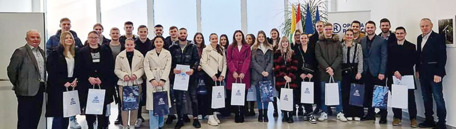
Dodjela jednokratnih potpora za studente