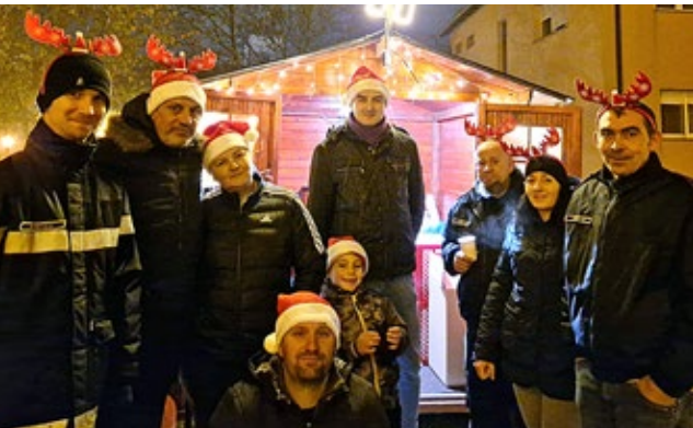
DVD Rovišće sudjelovao je na organizaciji adventa u Rovišću