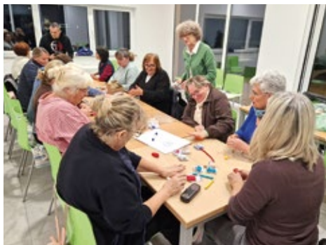
Radionica u organizaciji Hrvatskog fotosaveza - Udruga žena Rovišće