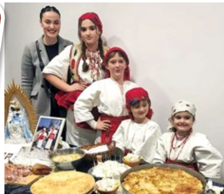
Večer kulture i zajedništva