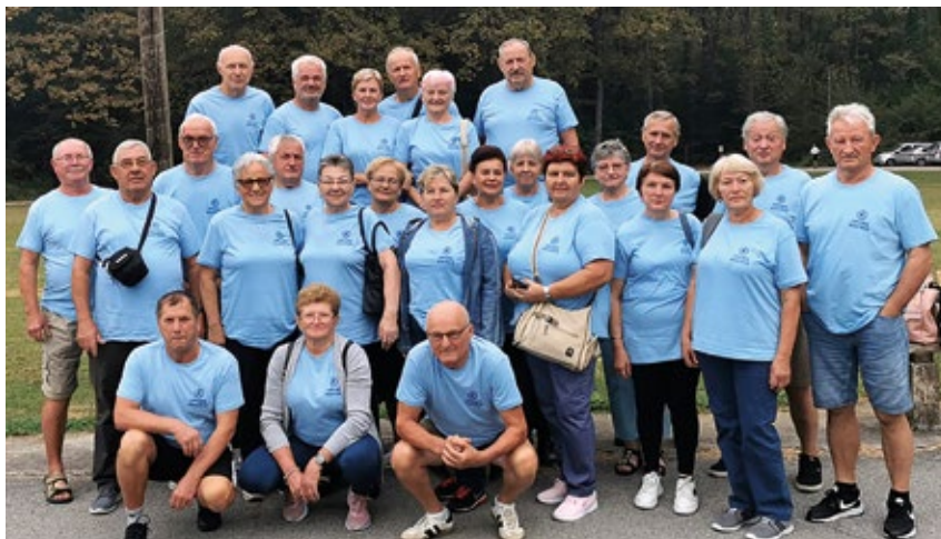
Sportski susreti umirovljenika u Kukavici - Udruge umirovljenika Rovišće