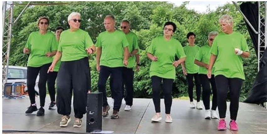
Plesna skupina Udruge umirovljenika Predavac "Zlatni koraci"