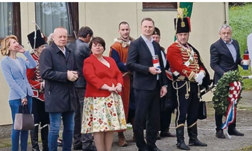
Dani Zrinskih i Frankopana u Zrinskom Topolovcu