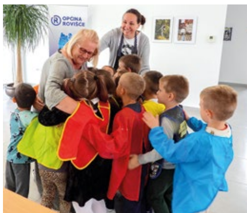
Radionica "Boje jeseni" - Dječji vrtić Palčica i Hrvatski fotosavez