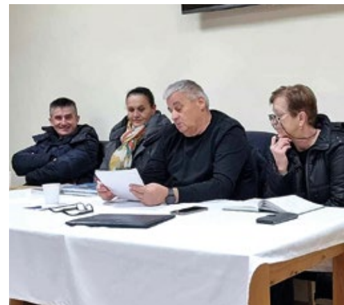
Redovna i izborna skupština Rame zajednice Bjelovar sa sjedištem u Rovišću