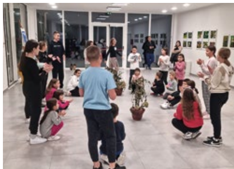
Redovna proba Kulturnog umjetničkog društva Rovišće