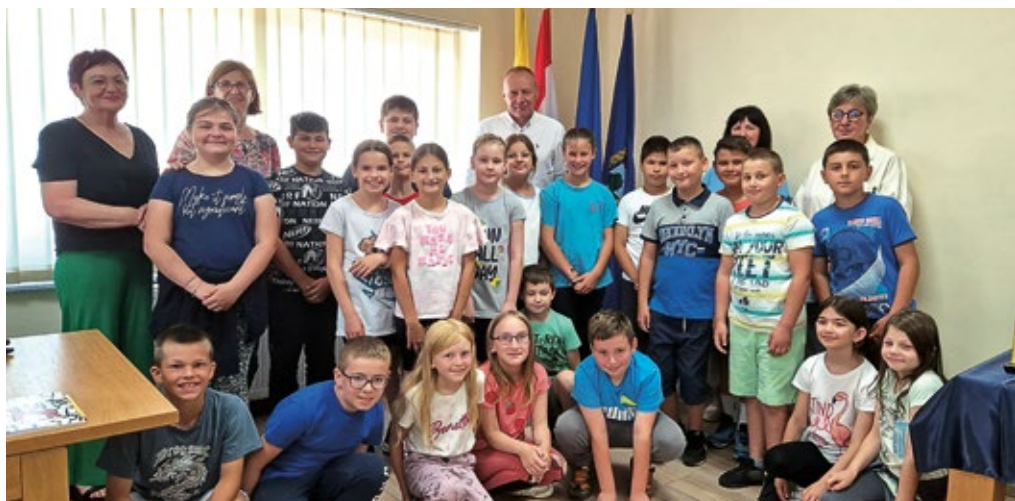
Posjet trećeg razreda OŠ Rovišće općinskom načelniku