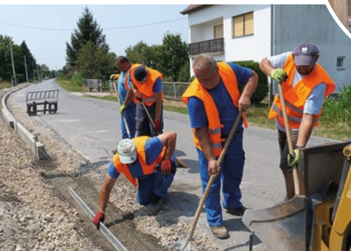
Izgradnja nogostupa od Rovišća prema Kraljevcu, III. faza