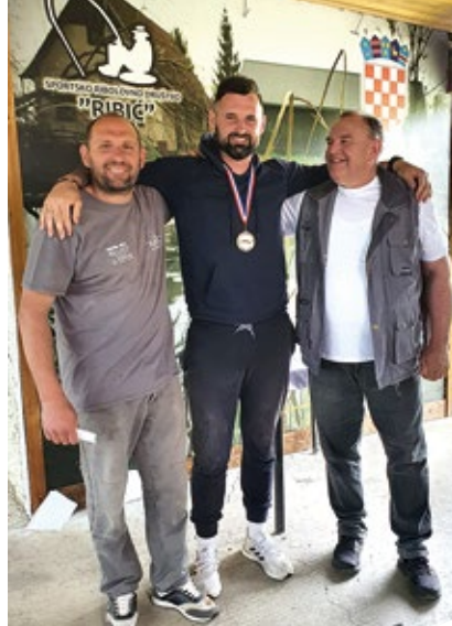
ŠRD "Ribič" Prvosvibanjsko natjecanje