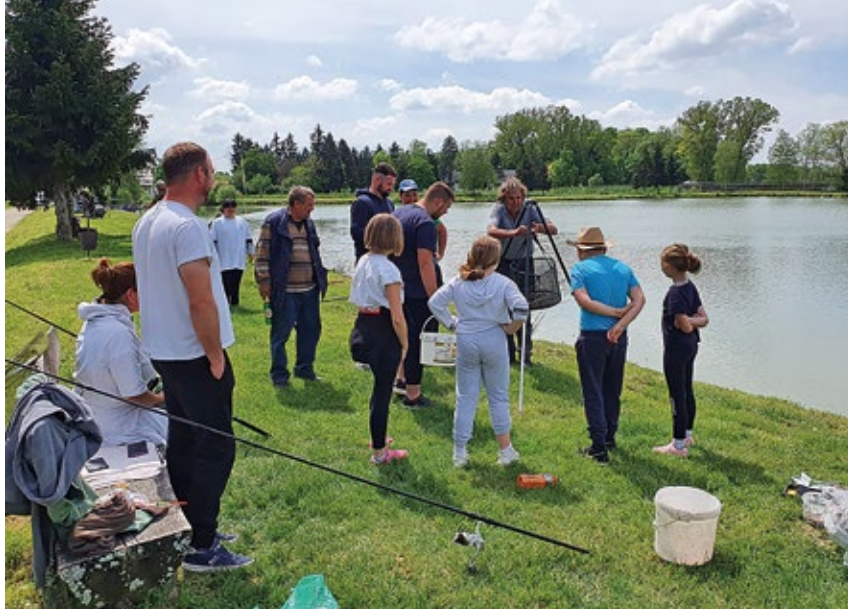
ŠRD "Ribič" Rovišće - 1. svibnja