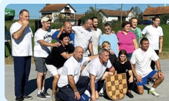
Tradicionalni nogometni turnir "El Clasico" u Žabjaku