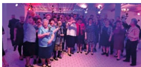
Međunarodni dan žena u Općini Rovišće

Sveti Nikola donio poklone Dječjem vrtiću Palčica, Rovišće