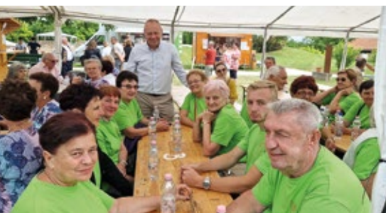
Posjet prijateljskoj općini Somogyvár u Mađarskoj s udrugama