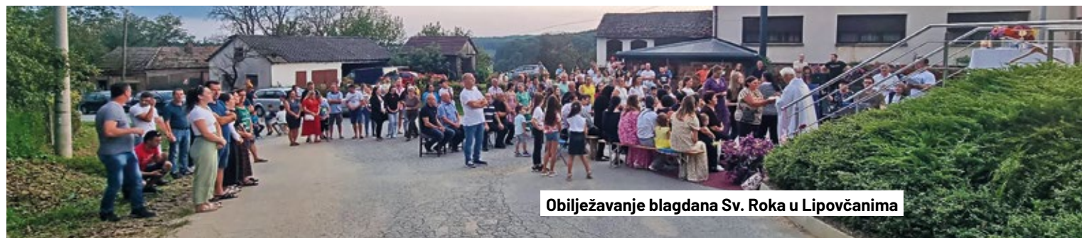
Obilježavanje blagdana Sv. Roka u Lipovčanima