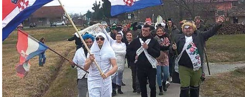
Žive jaslice - Advent u Prekobrdju