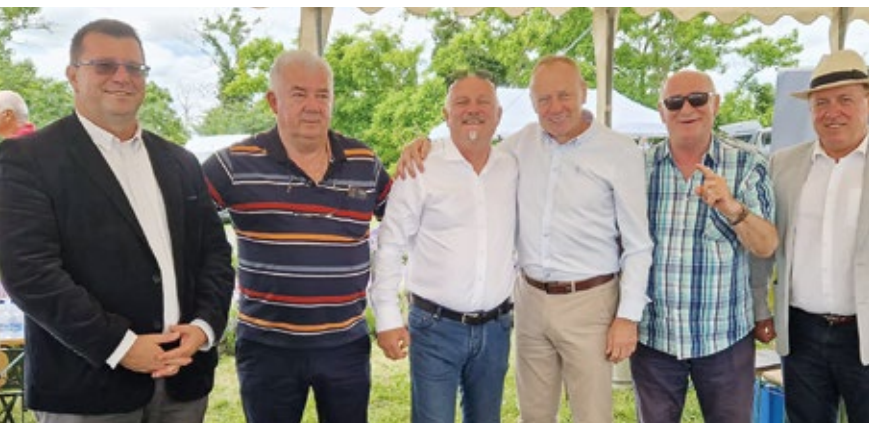
Dan Općine Somogyvar – Općina prijatelj