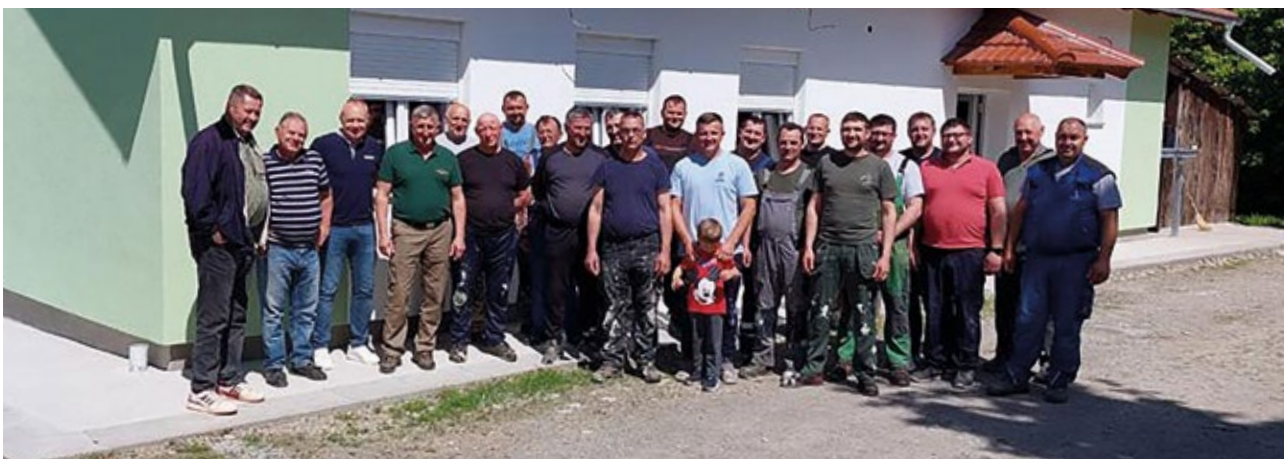
Lovačka udruga "Kuna" Kraljevac - radna akcija izrada fasade na lovačkom domu