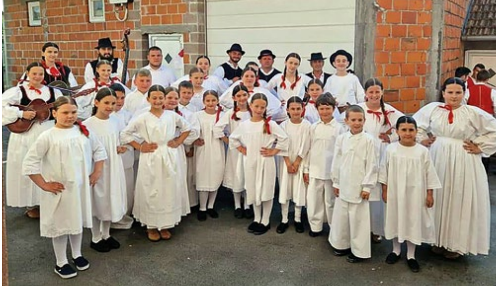
KUD Rovišće na natjecanju gdje su se izborili za državnu smotru u Kutini 2023.

Aktivne udruge na području Općine Rovišće provode različite projekte i inicijative te tako obogaćuju i unaprjeđuju lokalnu zajednicu. Općina je prepoznala važnost uloge udruge u zajednici te nastoji stvoriti povoljno okruženje za njihov rad, od financijske podrške, osiguravanja prostora za razne aktivnosti, pa sve do olakšavanja administrativnih procedura. Ponosni smo na sve udruge koje ostavljaju dubok trag na naše društvo i hvala im na nesebičnom trudu i radu kroz cijelu godinu!