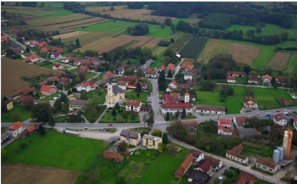
Slika 1. Općina Rovišće

Općina Rovišće smještena je u središnjoj Hrvatskoj, na rubnom, sjeverozapadnom dijelu Bjelovarsko-bilogorske županije te je dio općinske granice ujedno i županijska granica prema Zagrebačkoj i Koprivničko-križevačkoj županiji a unutar Bjelovarsko-bilogorske županije graniči s tri jedinice lokalne samouprave: gradom Bjelovarom i Općinama Kapela i Zrinski Topolovac. Prema dostupnim podacima površina Općine iznosi 78,7 km 2 .